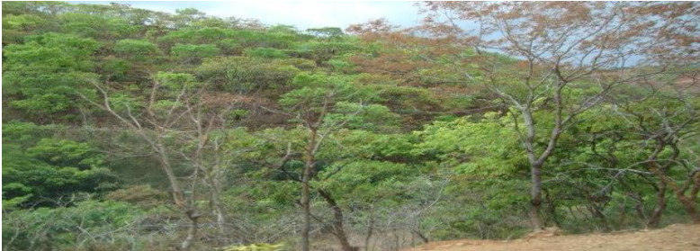
Misitu ya Miombo inayofaa kwa ufugaji wa nyuki

Misitu ya Miombo ambayo iko katika wilaya ya Ileje, inafaa sana kwa ufugaji wa nyuki, hata hivyo pamoja na kuwa na misitu na nyuki wengi katika wilaya ya Ileje, ufugaji wa nyuki bado unafanywa kwa kiwango kidogo sana. Wilaya ya Ileje in nchi ya milima milima na hivyo shughuli itakayoweza kuinua kipato cha mwananchi wa kawaida ni ufugaji wa nyuki.