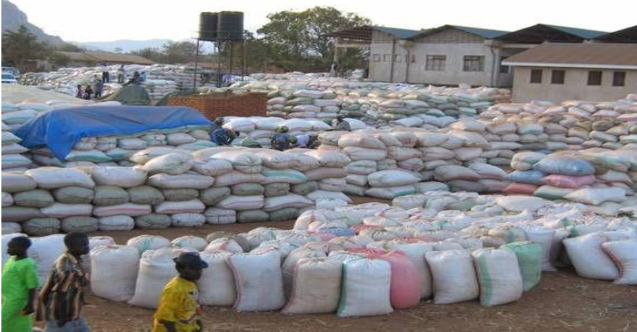
Picha ikionyesha ununuzi wa zao la mahindi katika soko la Isongole wilaya ya Ileje.